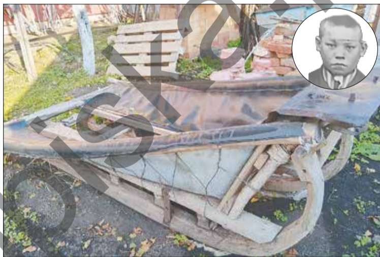
☑ Минразый абый Мортазин ясаган чана. Марат Ситдыйковның шәхси музей биләмәсендә саклана.

бирә торган булганнар. 1953-1954 елларда нефтьчеләр өчен Чупай авылында бараклар төзелгән, кибет, шәһәрдәге кебек зур базар ачылган. Газизулла абый шулай итеп базарга барып балалар чанасы сата башлый. Матур чаналар тирә-юньгә бик тиз тарала, - дип хатирәләре белән уртаклаша Наһия Миннегалимова.