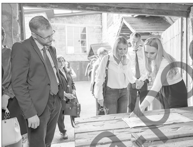
■ Бәйрәм кунаклары Шөгәрдә авылындагы Нефть музейда булдылар.

- Биредә нефтьнең беренче тонналары барлыкка килгән, Социалистик Хезмәт Геойлары, Советлар Союзы Геройлары туган һәм үскән. Без үз жирлегебездә «Татнефть» компаниясе профсоюз хәрәкәтенең тууы, беренче коллектив килешү, яшьләр һәм ветераннар оешмалары барлыкка килүе белән нык горурланабыз. Ата-бабаларыбыз тарафыннан нигез салынган традицияләргә хөрмәт итүне дәвам итәбез һәм хезмәт кешесе файда-