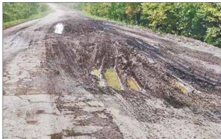
«Мондый юлда машинаның шөрәбе генә түгел, күчәре белән тәгәрмәче дә төшеп калырга мөмкин», - дип зарлана кәләйлеләр.

Урсалы халкы да зарлана юллардан. Бу микрорайондагы кайбер урамнарда юллар шулай ук бик авыр хәлдә, урамнарны яктырту буенча да эшләнәсе эшләр байтак. Күп балалылар яши торган районда, төгәлрәк айткәндә, Кырлай урамындагы юлны грейдер белән булса да тигезләп чыгуны сорый кешеләр. Халык