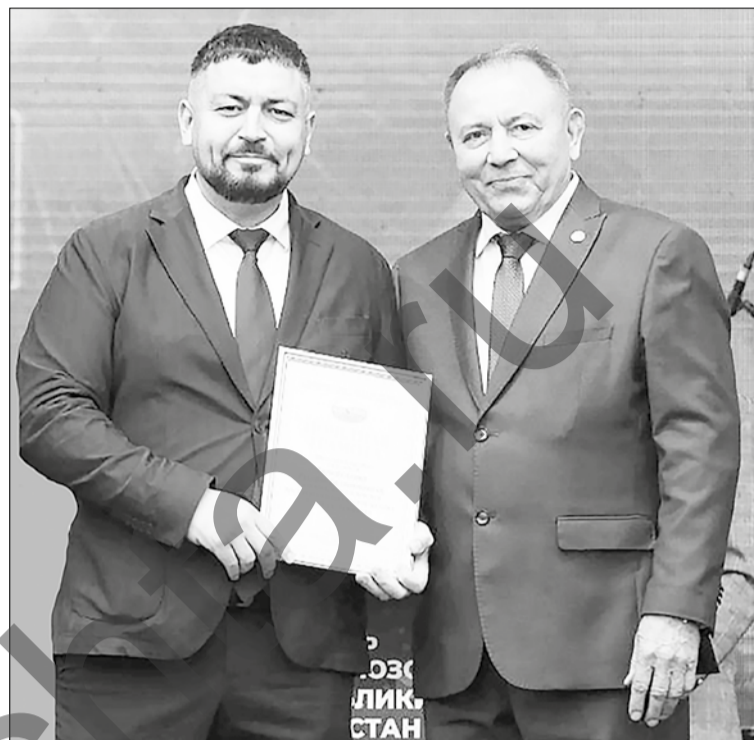
■ Тырыш хезмәткәрләр Татнефть Профсоюз житәкчеләге кулыннан лаеклы бүләкләр алды.

нефть сәнәгәте министры, «Татнефть»нең икенче житәкчесе булган В. Шашин һәйкәленә, Лениногорскида Геройлар Аллеясында һәм Нефтьчеләр аллеясында чәчкәләр салынды.